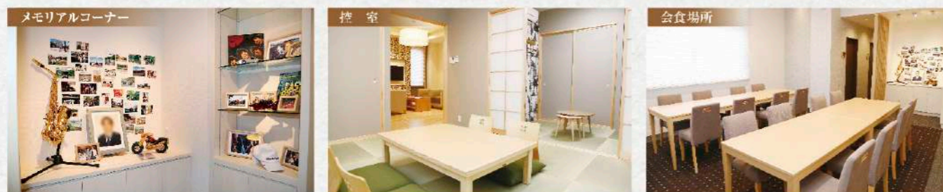
メモリアルコーナー 故人様との思い出を語らう メモリアルコーナーを設置しています。