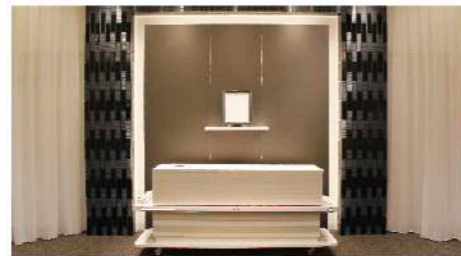
【プランに含まれるもの】