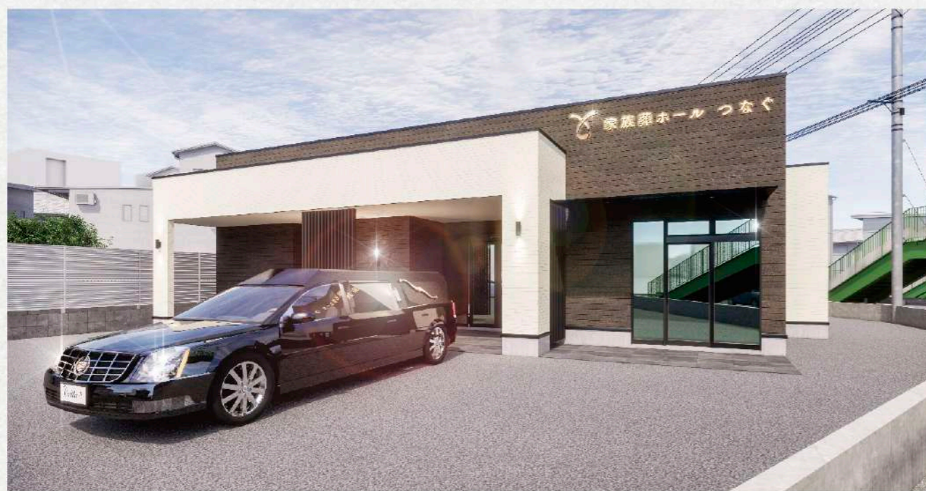
1組貸し切りでご葬儀を行う家族葬専用式場となっています。少人数～20名前後の式にぴったりな式場です。