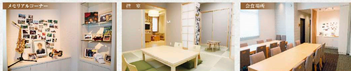
メモリアルコーナー 故人様との思い出を語らう メモリアルコーナーを設置しています。