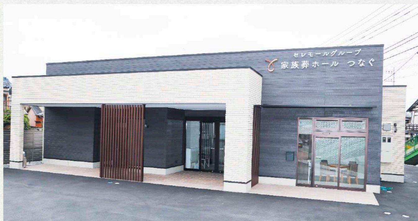
1組貸し切りでご葬儀を行う家族葬専用式場となっています。少人数～30名前後の式にぴったりな式場です。